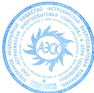
Щербакова Л.И. Главный бухгалтер

Примечания на страницах 9-27 являются неотъемлемой частью настоящей сокращенной промежуточной финансовой отчетности.